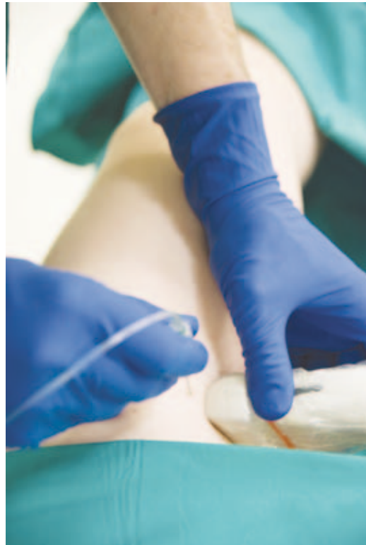
Ryc. 41-1. Na zdjęciu przedstawiono sposób wykonania blokady nerwu udowo-goleniowego w środkowym odcinku uda z dostępu od przedniej części uda pod mięśniem krawieckim techniką in-plane.