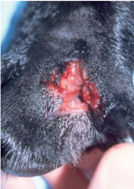
RYCINA 3-77 Bakteryjne pododermatitis . Widoczna sącząca przetoka o przewlekłym charakterze (czyrączność stóp) zlokalizowana w przestrzeni międzypalcowej psa spowodowana była obecnością ciała obcego (fragmentu rośliny).