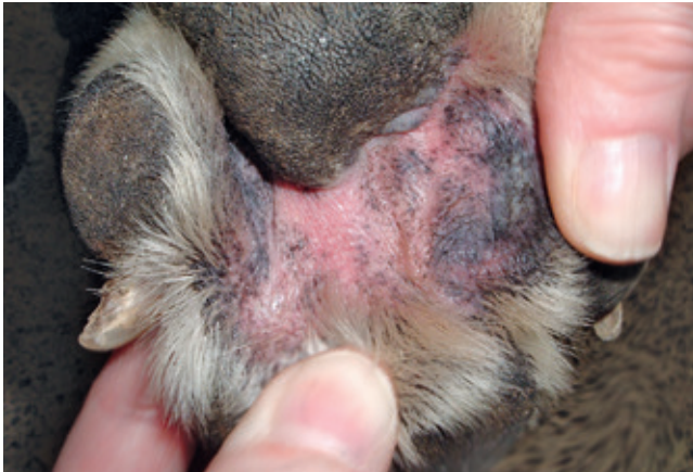
RYCINA 3-75 Bakteryjne pododermatitis . Rumień i wyłysienie w przestrzeni międzypalcowej u psa z alergią. Infekcja bakteryjna miała w tym przypadku charakter wtórny w stosunku do schorzenia alergicznego i wynikała z wylizywania stóp przez psa, co stałe podnosiło poziom wilgotności skóry w przestrzeniach międzypalcowych zwierzęcia i sprzyjało zakażeniu.