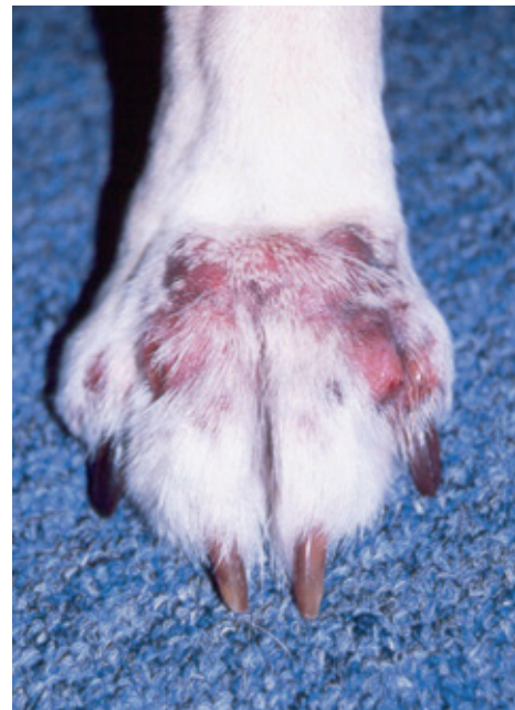
RYCINA 3-78 Bakteryjne pododermatitis . Rozlane wyłysienie, rumień i obrzęk obejmujące niemal całą stopę zwierzęcia. W tym ciężkim przypadku obecne były również liczne nadżerki oraz sącząca zmiany wokół łożyska pazura i w przestrzeni międzypalcowej.