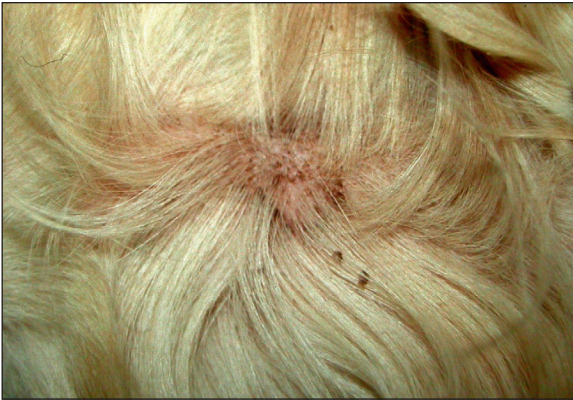
Rycina 12.2 Kryzka naskórkowa związana z ropnym powierzchniowym zapaleniem skóry u golden retrievera.