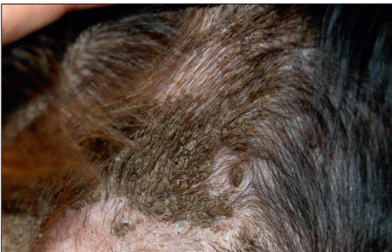
Rycina 12.3 Silnie przywierające łuski w przypadku rybiej łuski ( ichthyosis ) u gordon setera.

z włosami, komórkami i czasami lekami. Strupy oznaczają naruszenie ciągłości naskórka. Do powstawania strupów przyczynia się wiele chorób, takich jak schorzenia przebiegające z tworzeniem się pęcherzy, krost, nadżerek lub owrzodzeń. Strupy surowicze mają zabarwienie żółte lub miodowe, spotykane są przy otarciach, związanych z samouszkodzeniami, i przy świerzbie (ryc. 12.5). Strupy ropne są żółte lub brązowe, a nawet zielone. W dermatozach krostowych, takich jak ropne zapalenie skóry i pęcherzyca liściasta, często obserwuje się tworzenie ogniskowych, często okrągłych strupów, powstałych z zawartości krost po ich pęknięciu (ryc. 12.6 i 12.7). Ciemnobrązowe lub czerwone zabarwienie strupa świadczy o obecności krwi, co jest świadectwem głębokiego uszkodzenia tkanek.