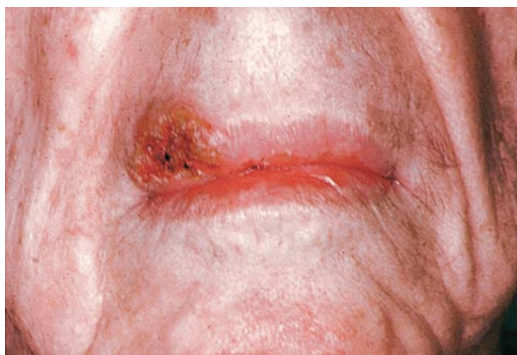
Rycina 7-7 Rak płaskonabłonkowy wargi górnej przylegający do kąta.