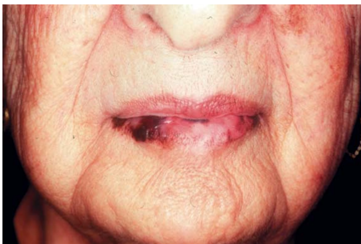
Rycina 7-5 Czerniak złośliwy wargi dolnej.