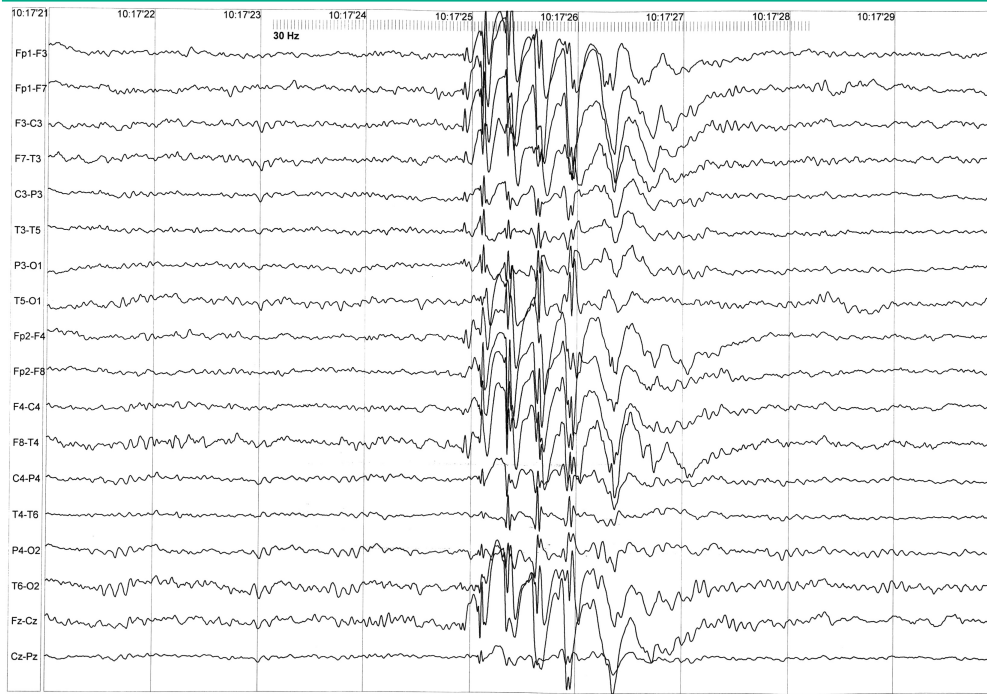
Rycina 1.2. Odpowiedź fotodrżawkowa u pacjenta z JME; częstotliwość błysków 30 Hz.