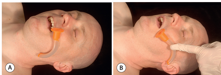
Ryc. 1.5 Metody dopasowania rozmiaru rurki Guedela. (A) Odległość pomiędzy siekaczami a kątem żuchwy. (B) Odległość pomiędzy kątem ust a skrawkiem ucha.