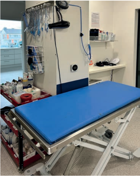
RYC. 2.1.4 Część przygotowawcza ze stołem jezdnym i wyposażeniem niezbędnym do prawidłowego przygotowania pacjenta.