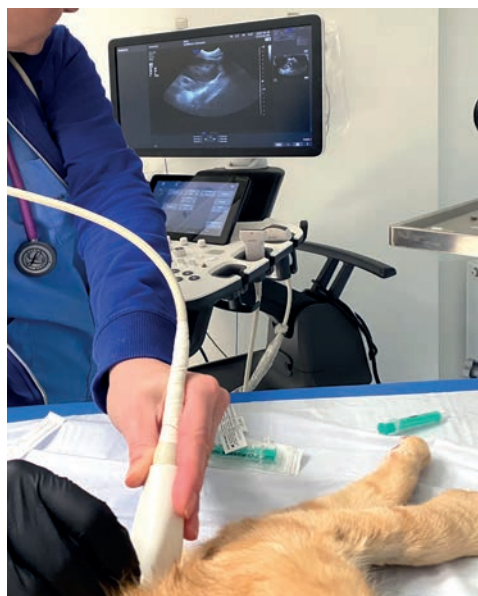
RYC. 3.16 Biopsja aspiracyjna cienkoigłowa pod kontrolą USG.

W planowaniu zabiegów onkologicznych istotne jest poznanie charakteru zmiany, która ma zostać usunięta, w celu określenia marginesów (zakres zdrowych tkanek dookoła miejsca objętego nowotworzeniem; złośliwe nowotwory wymagają usunięcia większej ilości tkanki) oraz oceny konieczności farmakologicznego przygotowania pacjenta. Biopsję cienkoigłową przeprowadza się za pomocą igły iniekcyjnej, do światła której wprowadzane są komórki zmiany przez wielokrotne jej nakłuwanie (ryc. 3.16). Biopsja może być