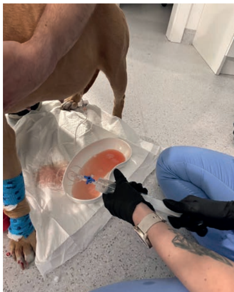
RYC. 3.13 Proces abdominocentezy u psa.

Punkcja stawów wykonywana jest przez ortopedę w celach diagnostycznych. Pobrana maź stawowa jest przekazywana do badania