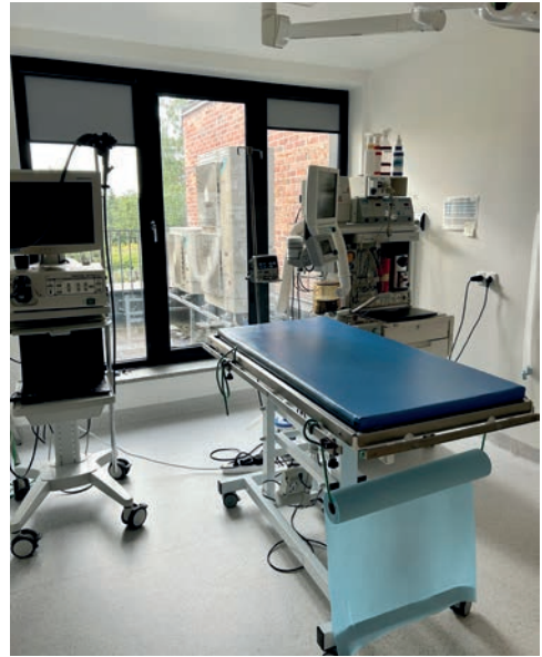
RYC. 2.1.5 Sala operacyjna.

cewniki dożylnie, podaje znieczulenie ogólne lub miejscowe oraz wykonuje inne procedury przygotowawcze. Personel pracujący w części przygotowawczej nosi odzież ochronną, taką jak fartuchy, czepki i rękawiczki, aby zminimalizować ryzyko kontaminacji. Sprzęt używany w tej strefie, np. maszynki do golenia bądź miski na preparaty dezynfekujące, jest regularnie czyszczony i dezynfekowany. W części przedzabiegowej mogą znajdować się stoły przygotowawcze, służące także do transportu większych zwierząt. W niektórych klinikach przechowywane są tu również sprzęt anestezyjologiczny, np. aparaty do znieczulenia wziewnego lub monitory parametrów życiowych.