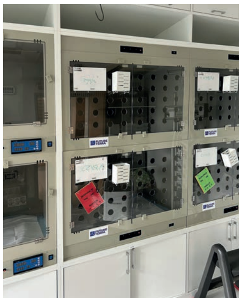
RYC. 2.1.3 Kocie kojce na oddziale intensywnej terapii o większej powierzchni umożliwiające dłuższą hospitalizację.