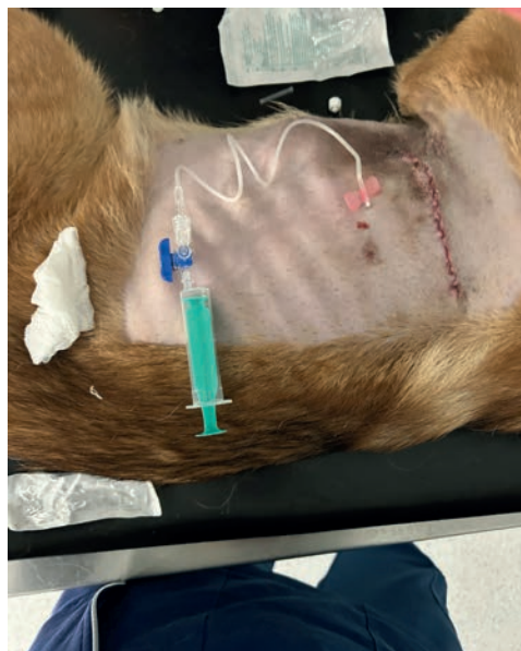
RYC. 3.14 Zestaw do torakocentezy po zabiegu na klatkę piersiowej.