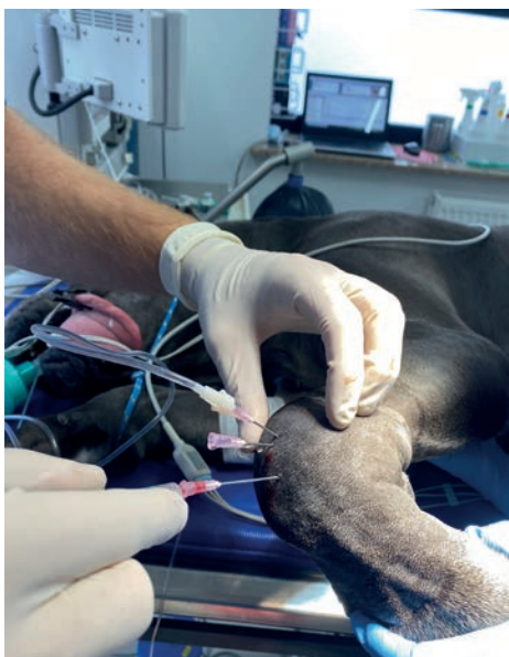
RYC. 3.15 Artrocenteza i kontrola jakości mazi stawowej.

bakteriologicznego i cytologicznego. Tak jak w przypadku pozostałych nakłuć ciała, istotna jest jałowość procesu. Prawidłowe przygotowanie okolicy polega na usunięciu sierści nad objętym chorobą stawem, umycie i zdezynfekowanie okolicy oraz prawidłowe ułożenie kończyny pacjenta. Do artrocentezy używa się igły (18–20 G) i strzykawki (3–10 ml) (ryc. 3.15).