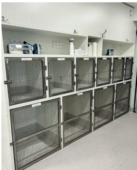
RYC. 2.1.1 Kojce psie na bloku operacyjnym. Zwróć uwagę na różne rozmiary kojców dostosowane do wielkości pacjenta oraz miejsce na umieszczenie pomp infuzyjnych do płynów.