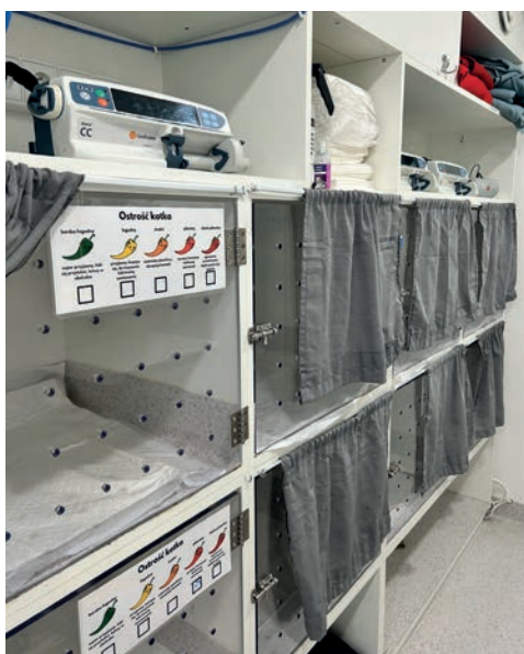
RYC. 2.1.2 Kocie kojce na bloku operacyjnym zaprojektowane zgodnie z zasadami Cat-Friendly ze skalą umożliwiającą ocenę agresji kota, wyposażone w zasłony, kocia muzykę, dyfuzor feromonów.

cyjny może współpracować z oddziałem intensywnej terapii, gdzie zwierzęta przez kilka dni odzyskują siły pod okiem lekarzy specjalistów (ryc. 2.1.3).